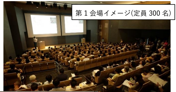
第1会場イメージ(定員 300名)