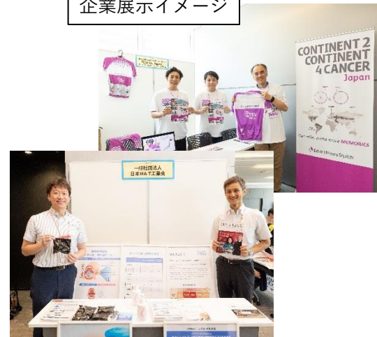
企業展示イメージ