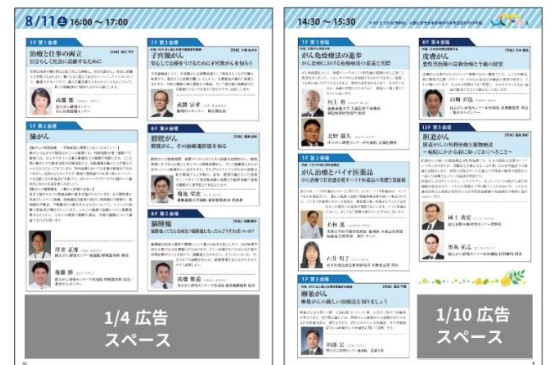
※画像は、イメージです