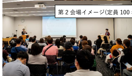
第2会場イメージ(定員 100名)